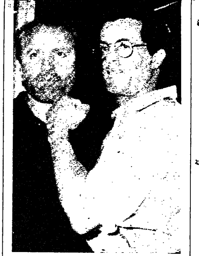
الممثل الاميركي سيلفستر ستالوني يمازح المصمم الإيطالي جيانبي فيراشي، قبيل عرض الأزياء الذي اقيم في ١٠ تموز الحادي لموديلات فصل الربيع.

وانتظر المحصورون ساعات طويلة في نيويورك اخباراً لضبط مادونا ووارن بيتي وهما يتحرجان من احدى غيب الليل. اما توم كروز فتأكدت علاقته مع شريكه كاترين تيرنر في البطولة في ايام الرعد. ويشغل المهنيون حول ما اذا كان هذا التراجع في الاقبال ناجم عن اتجاه عام الى الابتعاد عن السينما، ام عن ظاهرة عابرة عبر عنها الجمهور الاميركي احد اكثر الجماهير العالية ايماناً على السينما، وقبل ديك تريسي، و ايام الرعد، لم تعرف الصالات الاميركية ايضاً انطلاقة قوية حتى مع